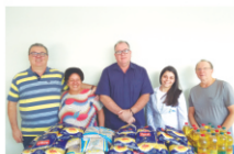
Casa Espirita Antonio Luiz Sayão doou gêneros alimentícios