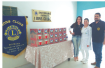
Lions Clube de Rancharia doou 222 litros de leite