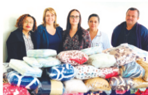
Fundo Social de Solidariedade de Rancharia doou 50 mantas

A todos que colaboraram nossos sinceros agradecimentos.