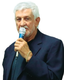
por Nelson Coletto Corrêa

O HMR , uma instituição filantrópica que atende uma microrregião denominada Alto do Capivari, composta pelos municípios de Rancharia, Iepê, Quatá, João Ramalho e Nantes, presta, mensalmente, oito mil atendimentos a uma população de aproximadamente cinquenta e oito mil habitantes. A cada ano, quase 100 mil atendimentos!