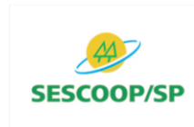
Sescoop doou gêneros alimentícios