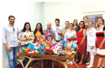
OAB Subseção Rancharia doou brinquedos