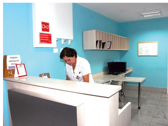
POSTO DE ENFERMAGEM