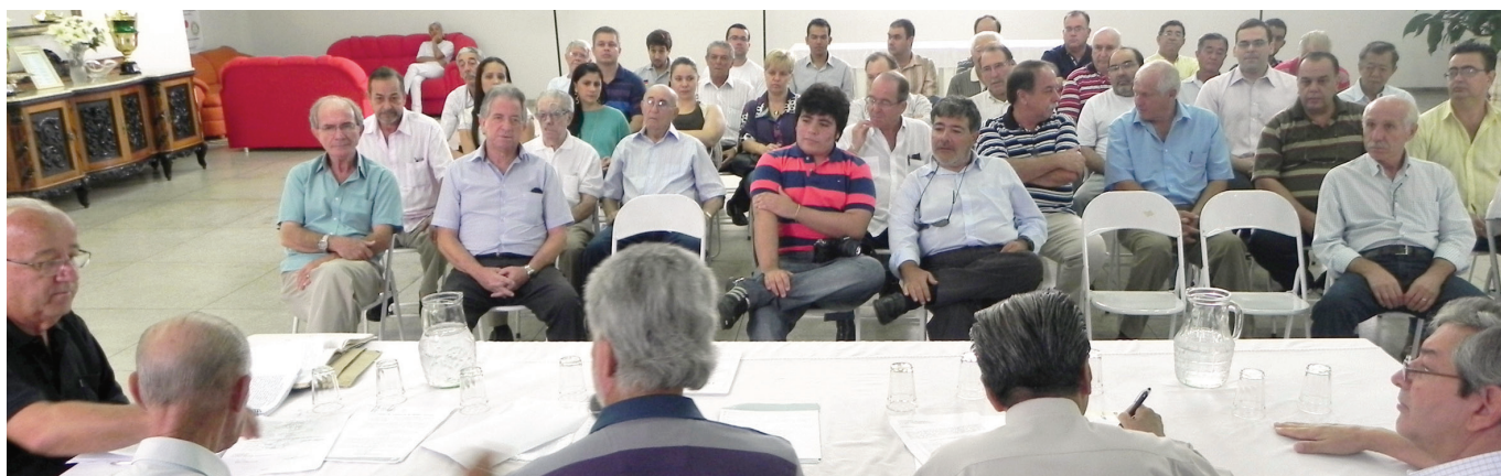
Assembleia foi realizada na sede do Rotary Club